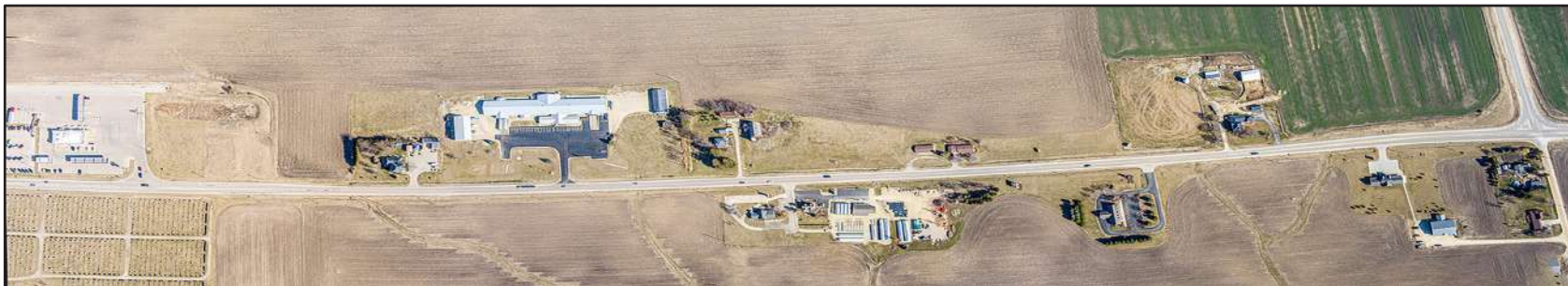
Highway 20 West - Stockton (Illinois)