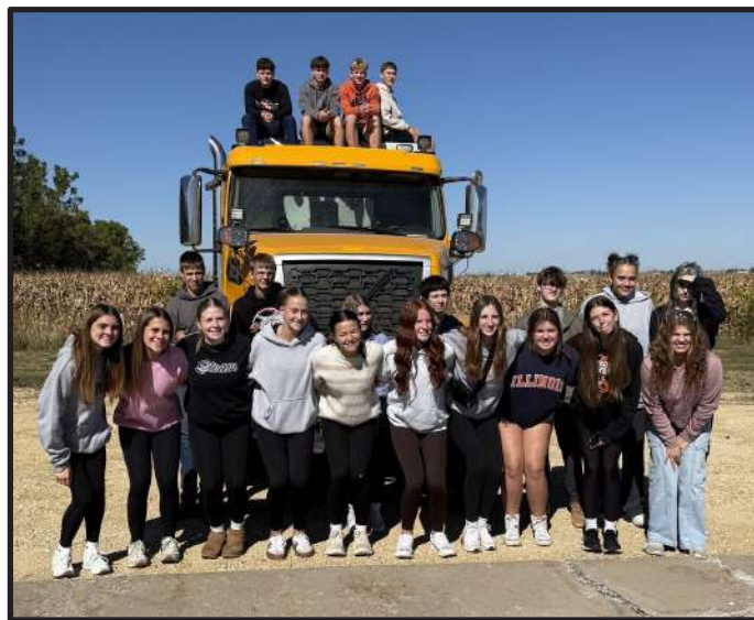
Chadwick-Milledgeville High con el Departamento de Carreteras del Condado de Carroll durante su visita a Zurn ElKay Water Solutions en Lanark (Illinois) en el Día de la Manufactura y los Oficios de 2025.

La próxima jornada será el jueves 8 de octubre de 2026.