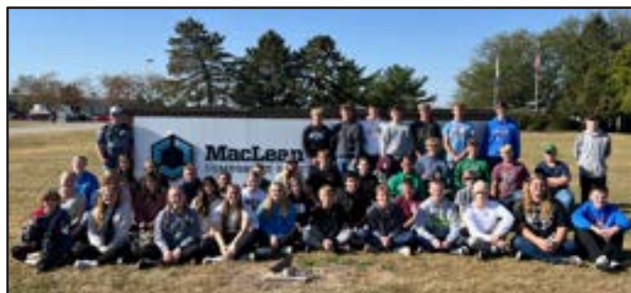
Alumnos de Eastland High School tras su visita a MacLean-Fogg Component Solutions - Metform, en el norte de Thomson (Illinois).