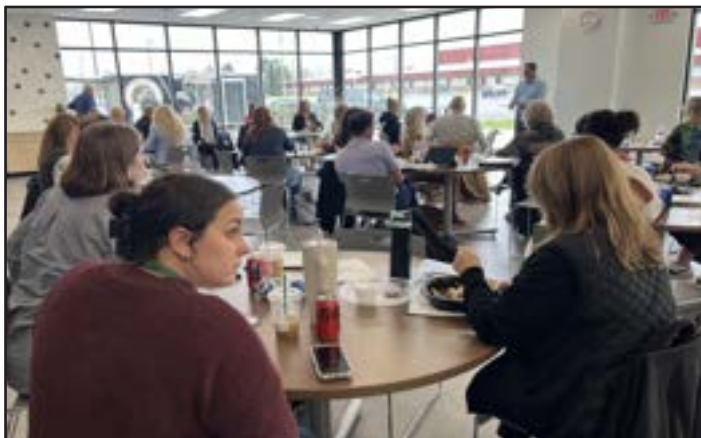
Programa “Lunch & Learn”, Davis Community Center, Mount Carroll (Illinois)